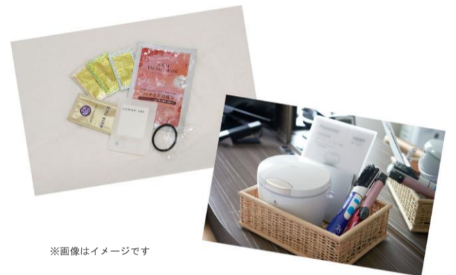
※画像はイメージです