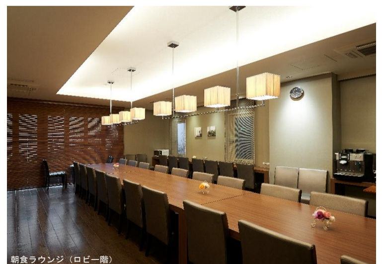
朝食ラウンジ(ロビー階)