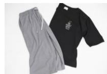
ホテルオリジナルパジャマ

◆全121室 ◆全室禁煙 (喫煙ブース有り) ◆女性専用フロア (ルーム) 設置。女性一人でも安心してご利用いただけます。 ◆全室鍵付きのプライベート個室 ◆共用シャワールーム有り