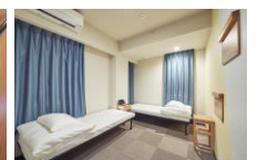
ユニバーサルツイン